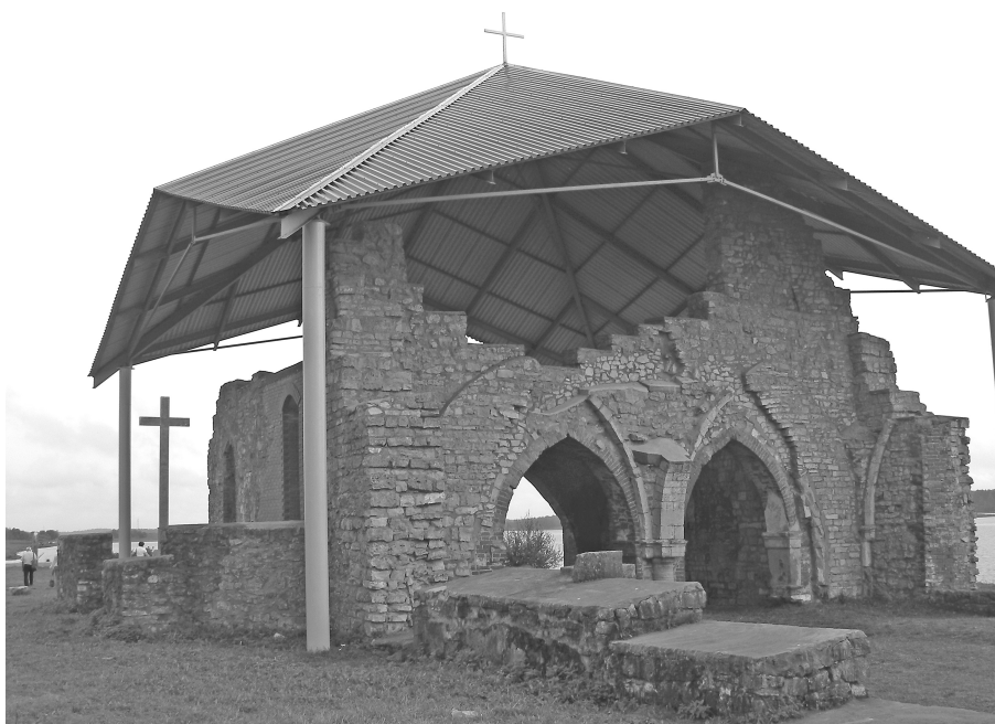
CC-BY SA2.5 Latvia United

Ved floden Daugava i landsbyen Üskull / Iksķile sydøst for Riga begyndte den kristne kolonisering af det nuværende Letland og Estland. En del af murene fra den første stenkirke står endnu.