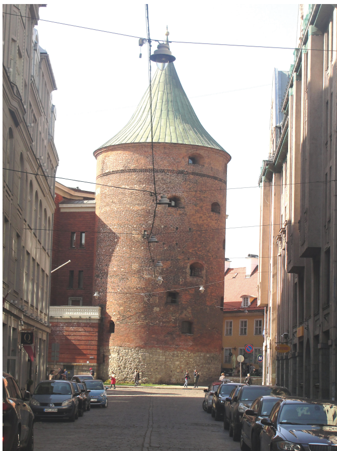
Krudttårnet i Riga, nu en del af krigsmuseet.

Rīdzene, som byen er opkaldt efter. I forbindelse med voldanlæggets opførelse blev vandet i stedet ledt ind i den nye voldgrav, foran det nye anlæg af bastioner. Senere blev Riga-floden helt fyldt op med jord, da den havde udviklet sig til en stinkende kloak.