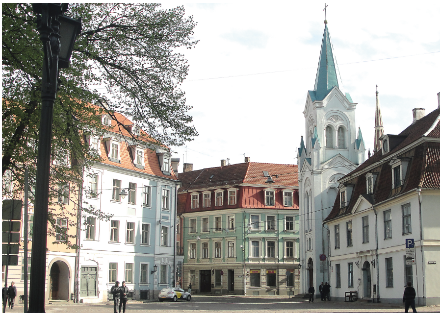
Slotspladsen med den katolske Sorgernes Gudsmoders kirke.

Letlands hovedstad Riga ligger omtrent midt i landet, ca. 30 km fra munden af floden Daugava i Riga-bugten. Det er den største by ikke blot i Letland, men i alle de baltiske lande, også selvom Litauen har en større befolkning end Letland. Dermed er den meget stor i forhold til Letlands størrelse. Omtrent en tredjedel af landets befolkning bor i Riga, og cirka halvdelen af befolkningen bor i en afstand af højst 50 km fra Riga.