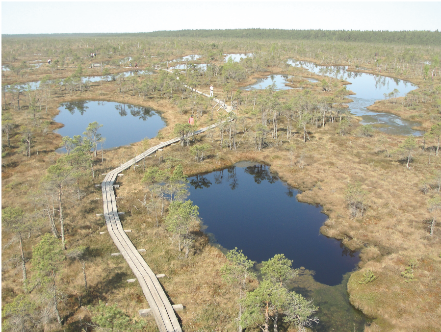
Stort moseområde ved Ķemeri vest for Riga.

Der findes også et mindre privat bil- og motorcykelmuseum i bydelen på den anden side af Daugava-floden på adressen Kantora iela 22a ( automuzejs.lv ).